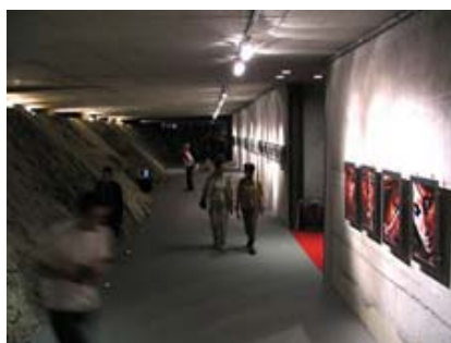
S-galerija: Fotografija, art video, animacije in kratki filmi