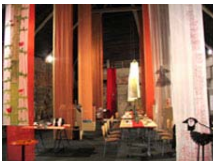
Hribarjeva dvorana: objekti (kiparstvo, keramika, grafika, tekstil, restavracija, ambient) in virtualni sprehodi na računalnikih

Vendar le od 17. septembra do 10. oktobra, v času razstave "Desetka!", Šole uporabnih umetnosti FAMUL STUART!