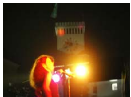
Skupina Katalena je Šoli za rojstni dan podarila koncert na grajskem dvorišču.

Septembrski obiskovalci Ljubljanskega gradu si bodo gotovo zapomnili kopico simpatičnih bitij, ki jih pričakajo že ob vstopu skozi grajska vrata. Pravzaprav bitij ne vidimo, iz tal štrlijo le njihove kot paprika rdeče kape. Nihče ne ostane hladen, prav zabavno je prisluškovati vzklikom in ugibanjem, za kaj gre in pogostim skušnjavam, da bi si enega vzeli za spomin. Ker pa vemo, da ukraden škrat ni srečen škrat, je olajševalna okoliščina informacija, da lahko škrata posvojimo in s tem celo prispevamo v humanitarne namene. (Informacije dobijo obiskovalci na recepciji razstave Desetka! v Hribarjevi dvorani ali, ob lepem vremenu, kar na dvorišču v bližini druge skupine škratov.)