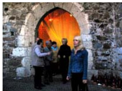
Vhod v Peterokotni stolp, ki se spreminja glede na svetlobo v dnevu